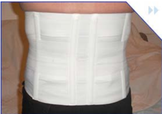
faja dorso lumbar tallas: s- m – l – xl cod: kmfd2014 color: blanca

indicado a la inestabilidad de los ligamentos tantomedial como lateral. tambien esta indicado en una menor o moderada inestabilidad de la articulación de la rodilla, y tambien en una lesión de los meniscos. y en deformidades degenerativas o traumáticas de la articulación de la rodilla.