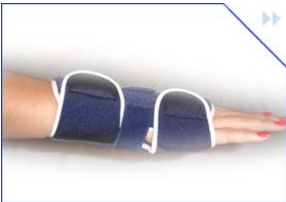
ortesis de muñeca diseño der. – izq. talla: s – m – l – xl cod: kmom2004 color: azul marino.

Es un producto utilizado para todo tipo de lesiones de mano. En todo tipo de lesiones de la muñeca ya sean crónicas, post traumáticas o en el post-operatorio, tratamiento conservador de tendinitis y tendosinovitis