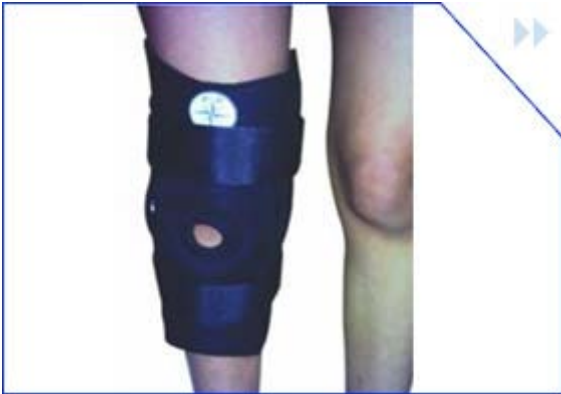
rodillera con barra lateral talla: s – m – l – xl cod: kmrbl2016 color: azul marino

indicado a la inestabilidad de los ligamentos tantomedial como lateral. tambien esta indicado en una menor o moderada inestabilidad de la articulación de la rodilla, y tambien en una lesión de los meniscos. y en deformidades degenerativas o traumáticas de la articulación de la rodilla.