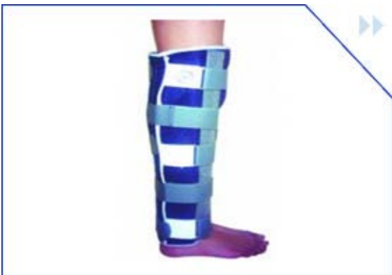
inmovilizador de rodilla talla: s- m- l – xl cod: kmir2017 color: azul marino

indicada para inmovilizar la articulación de la rodillera