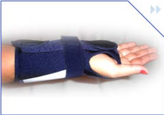
muñequera simple lycra c/ ferula (derecha – izq.) talla: s – m – l – xl cod: kmms2001 color: azul marino

Es un producto utilizado para todo tipo de lesiones de mano. En todo tipo de lesiones de la muñeca ya sean crónicas, post traumáticas o en el post-operatorio, tratamiento conservador de tendinitis y tendosinovitis