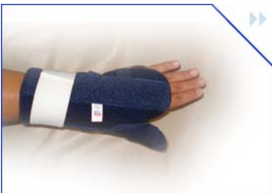
muñequera dedo pulgar ambidiestra con ferula talla: s – m – l – xl cod: kmmd2002 color: azul marino

muñequera inmovilizadora con dedo pulgar confeccionada con bandas de elástico diseñada con férulas moldeables de aluminio ubicadas en la palma de la mano.